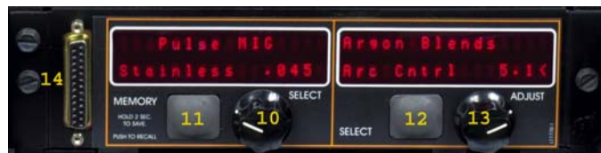
Панель специальных процессов