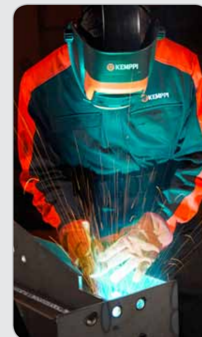
Сварочные респираторы Kemppti FreshAir предлагают экономичное решение для высокого уровня индивидуальной защиты.