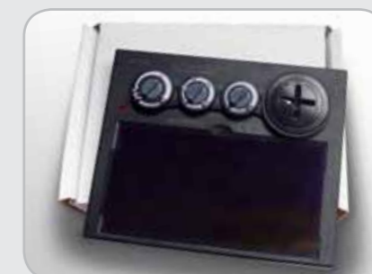
Автоматически затемняющийся сварочный фильтр Kemppti (9873058) можно устанавливать как на маску Beta 90 FreshAir, так и на маску Delta 90 FreshAir.