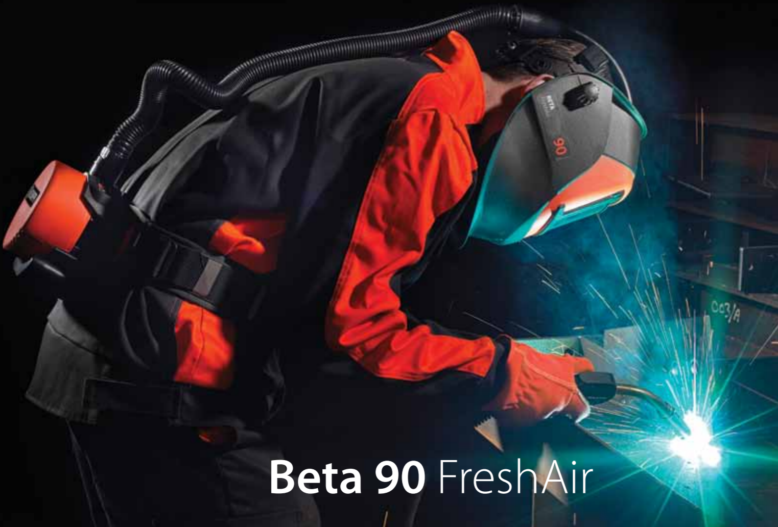
Beta 90 FreshAir