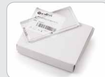
Для улучшения видимости при выполнении работ на близком расстоянии при малом токе можно устанавливать увеличительные линзы.