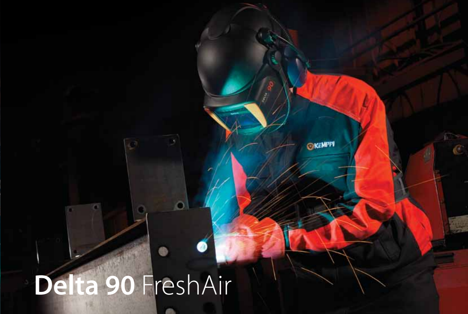
Delta 90 FreshAir